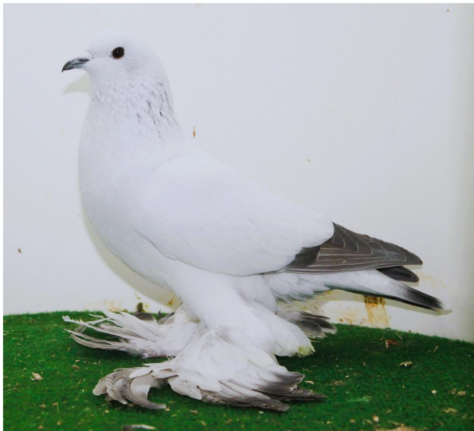
(Archivfoto LV Taubenschau LV Hannover 2023)