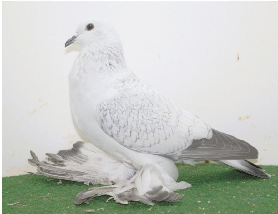
(Archivfoto LV Taubenschau LV Hannover 2023)