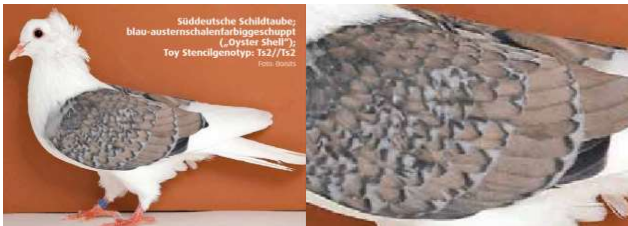
Die Färbung „Oyster Shell“ zeichnet sich oft durch leichte graue Spritzer im Rosa aus, was bei starker Ausprägung in Richtung Pfeffer geht und daher nicht das Ziel sein kann.