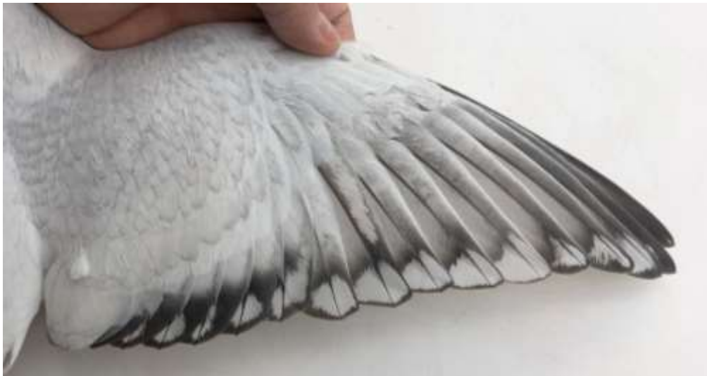
Porzellanfarbige Eistaube mit dem Toy Stencilgenotyp: Ts1//Ts1; Ts2//Ts2; ts3//+