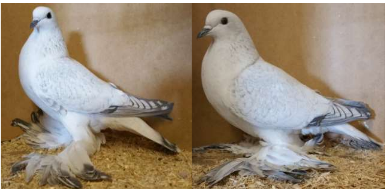
Sehr vielversprechende 0,2 aus dem Jahrgang 2016 vom Züchter Lothar Fucker