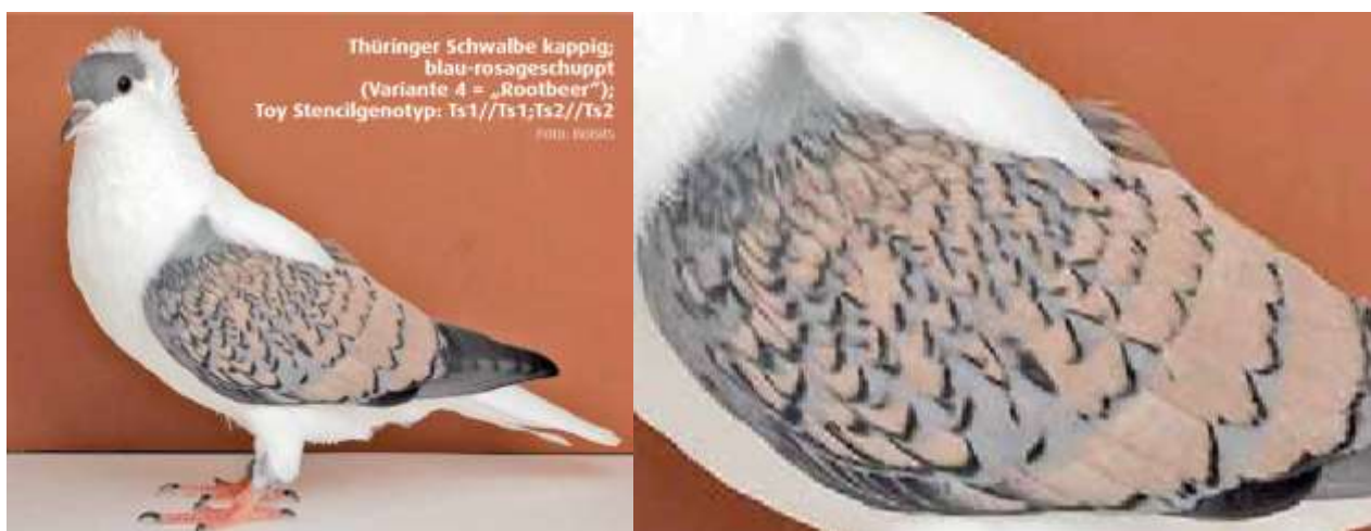
Die klassische Färbung Rosageschuppt mit reinerbig vorliegenden Toy Stencilgenotypen Ts1 und Ts2 kann für unsere Porzellanfarbigen ein idealer Kreuzungspartner sein.