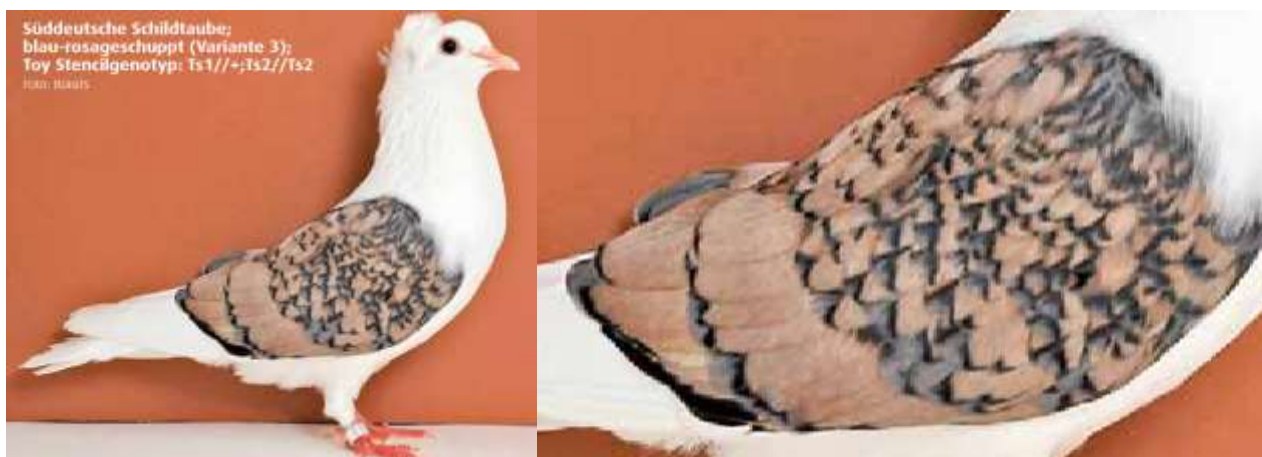
Dieser Toy Stencilgenotyp ist nicht reinerbig auf Ts1, was dazu führt, dass die Rosaschuppung mehr ins gelblich tendiert. Der Enabler ts3 ist hier nicht vorhanden, die Schuppungsfarbe daher noch sehr intensiv.