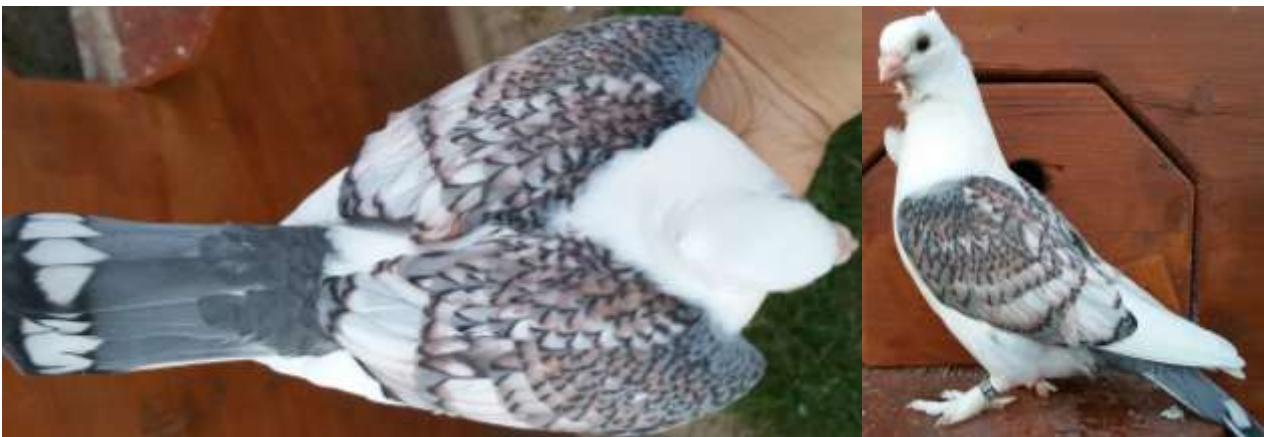
So sahen früher auch unsere Weißgeschuppte im Nestgefieder aus. Ein Anzeichen dafür, dass Ts2 nicht reinerbig vorliegt, sehr oft mausern diese Tiere völlig weiß durch.