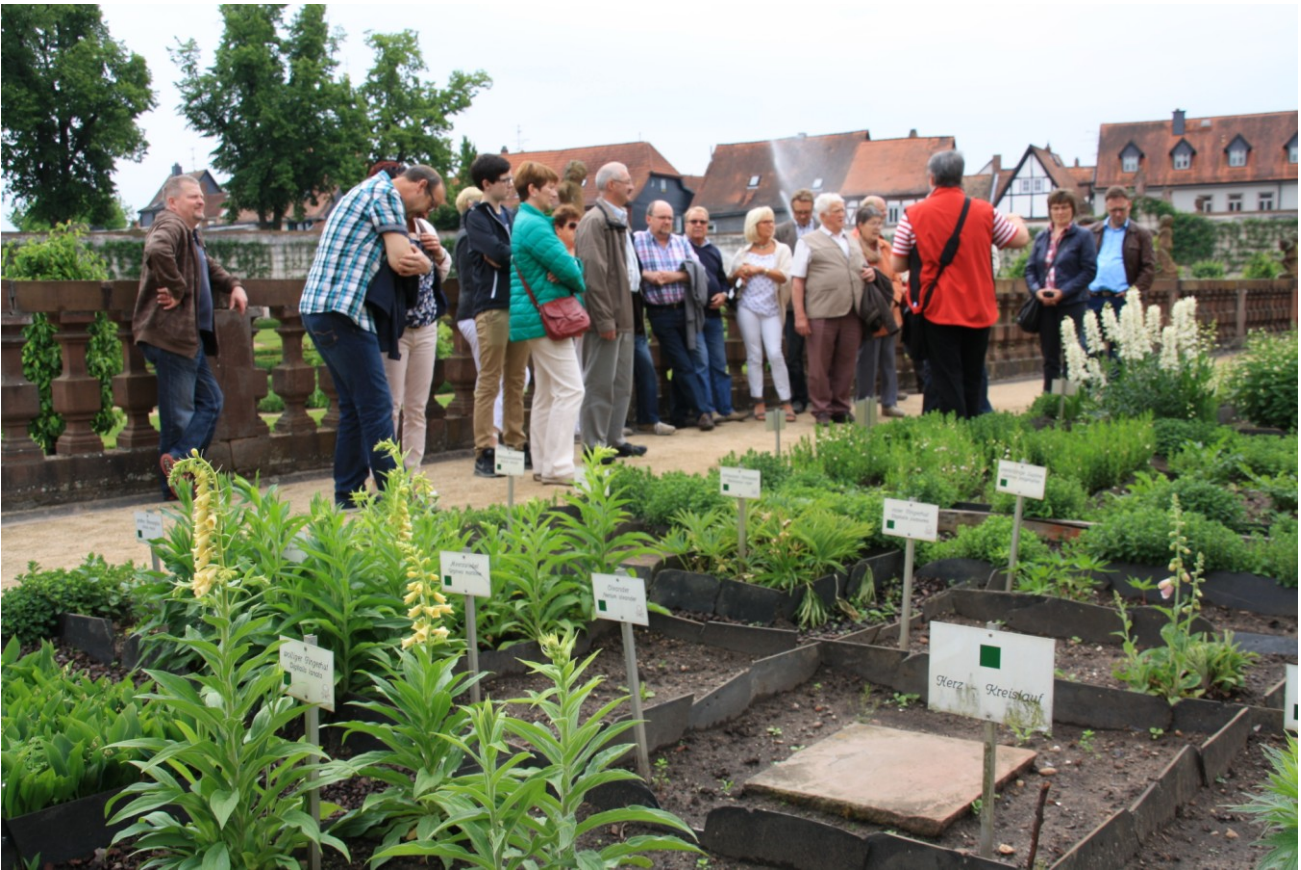
Stadtführung Seligenstadt, Klostersgarten