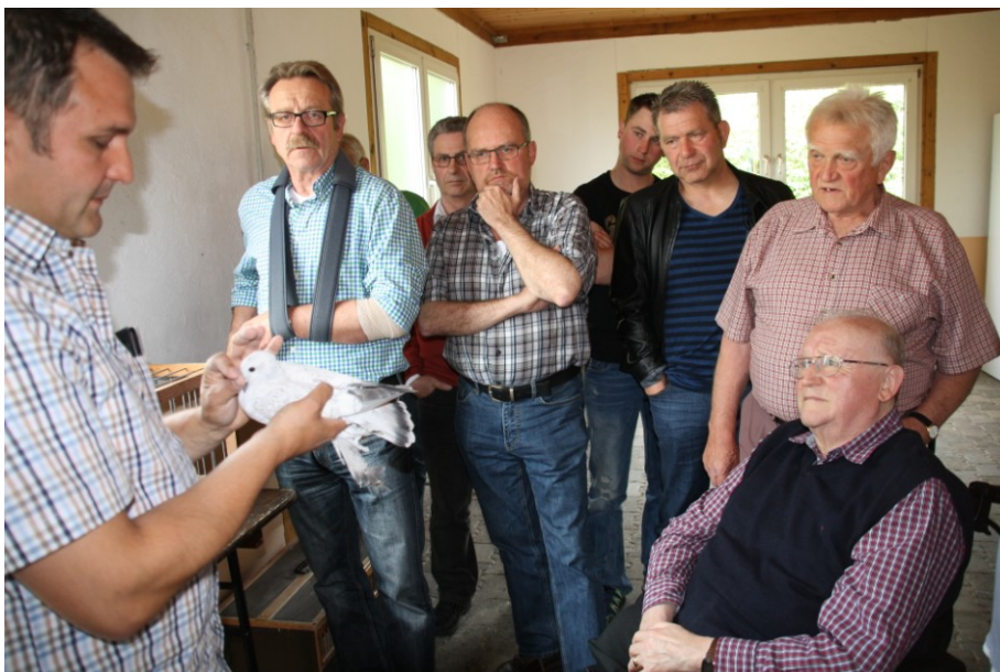
Tierbesprechung zur Jahreshauptversammlung