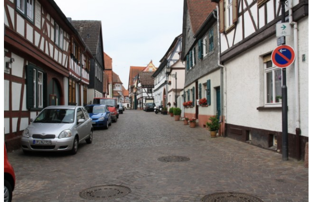
Ausfahrt und Stadtbesichtigung Seligenstadt