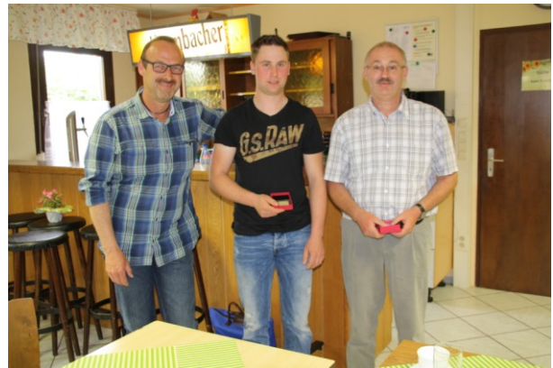
Abendveranstaltung im Vereinsheim mit Vergabe der Silbermünzen